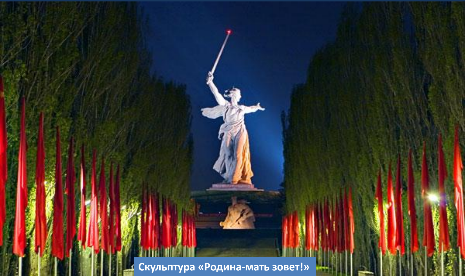
Скульптура «Родина-мать зовет!»