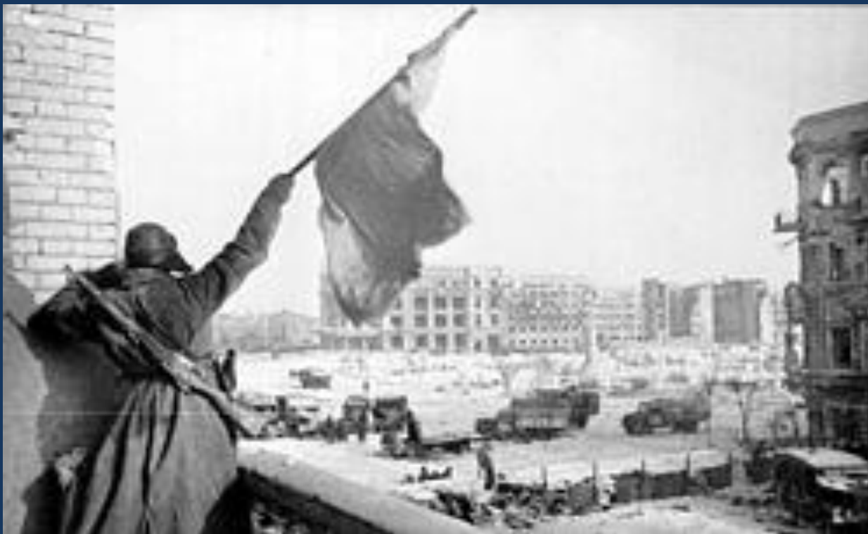
Флаг над освобождённым городом, Сталинград, 1943 год